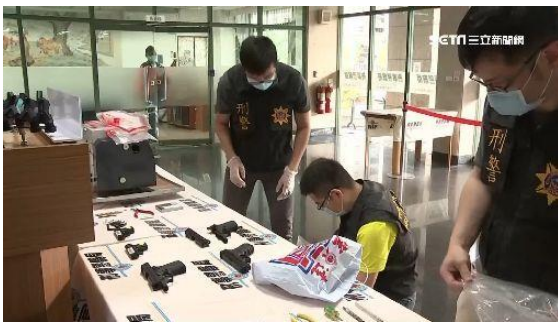
警方 8 天內破獲 4 間地下兵工廠。

男子左右各有一名員警緊緊守住，他從警察局要被帶往地檢署。男子下班窩在工作室內，竟然是忙著改造槍枝。