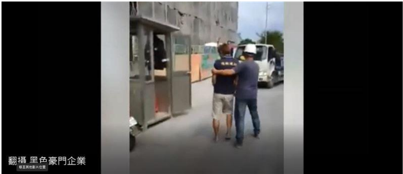
▲貨車司機被旁人拉開，保全則是繼續錄影。